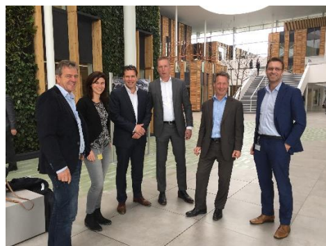
Programmacommissie Circulaire Huisvesting